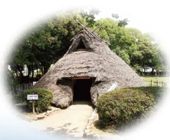
弥生時代の暮らしをうかがわせる田能遺跡 (尼崎市)