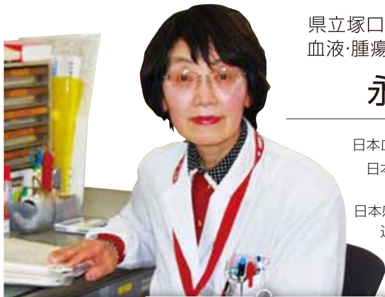
県立塚口病院 副院長、血液・腫瘍内科部長・科長

専門の病院が少ない血液・腫瘍内科ですが、阪神地区の拠点病院のひとつ、また京都大学医学部附属病院血液・腫瘍内科関連病院のひとつとして近隣の先生方より多数患者様をご紹介いただいております。