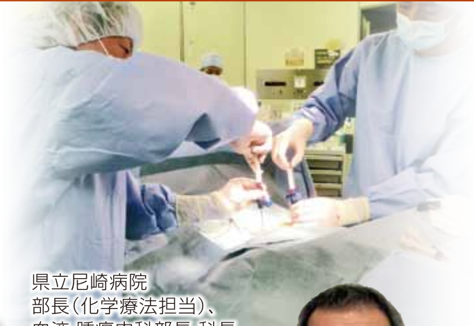
県立尼崎病院 部長(化学療法担当)、血液・腫瘍内科部長・科長

日本血液学会血液専門医 日本内科学会認定総合内科認定医・指導医 日本感染症学会認定ICD 近畿血液学会評議員