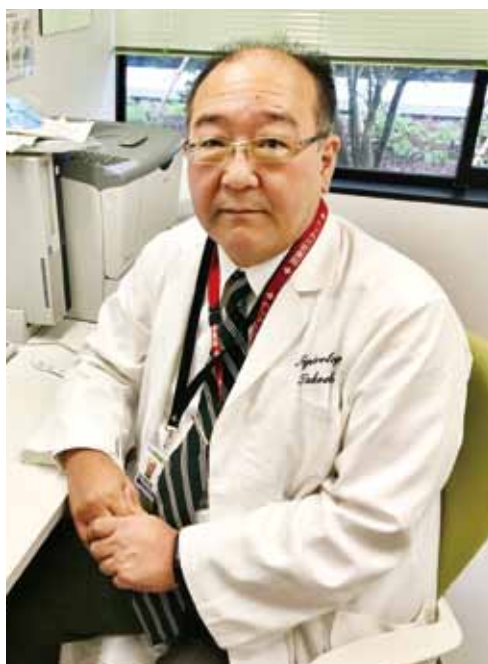
教育部長 腎臓内科長 透析センター長

5階の屋上庭園に面して存在する当センターは広々としたワンフロアで、2面に広がる解放感あふれる大きな窓からは緑の木々や街並みが楽しめます。18床ある透析ベッドの間隔は1メートルと広くとっており、明るい空間でゆったりと透析の時間を過ごせるよう工夫しています。また、感染症などの病状に対応できるよう、個室の透析ベッドを2床有しています。腎透析センター内にある各診察室では、腹膜透析外来やシャント外来に加えて、これから透析療法を必要とする患者さんへの腎代替療法説明外来も行っており、腎不全の患者さんをトータルでサポートできるような体制を整えています。