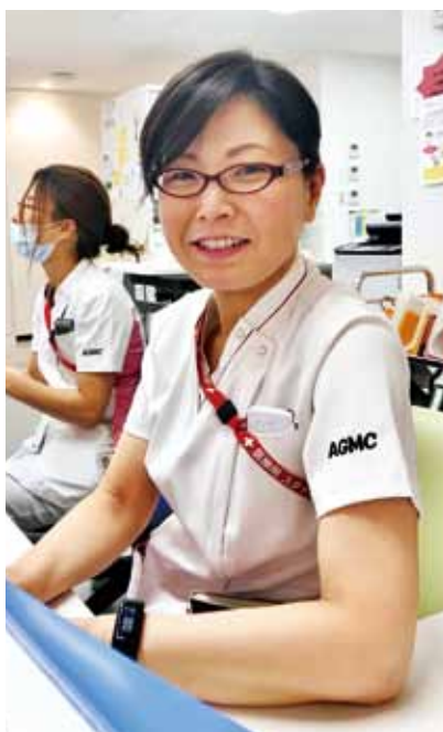
透析センター 看護師長