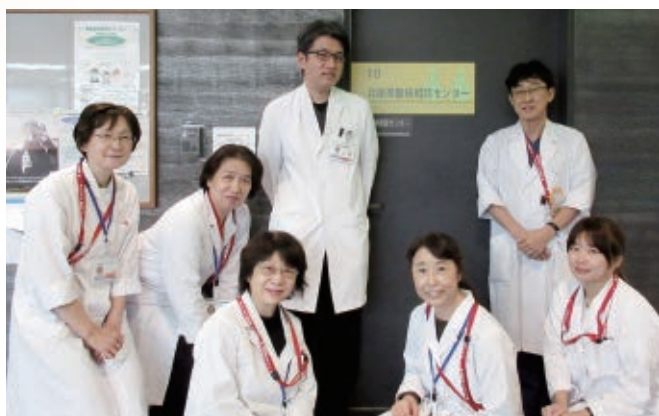
北玄関から入ってすぐ黄色い看板が目印です

コロナ禍でデジタル活用が進んだことにより、当センターとしても県内の難病の方や地域支援者に、よりわかりやすい情報発信を心がけ、神経難病に関する疾患の説明や医療機関の情報紹介、Facebookの開設などホームページをリニューアルしています。また、難病教室や研修会の開催方法もWEB開催やハイブリッド開催等新たな取り組みを行っているところです。