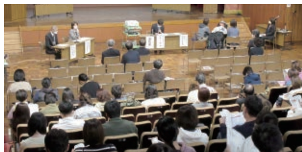
難病医療ネットワーク支援協議会神経難病部会研修会