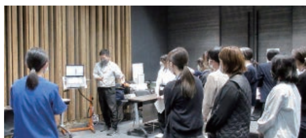
難病セミナー（コミュニケーション支援研修）