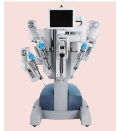
以前からあるda Vinci Si