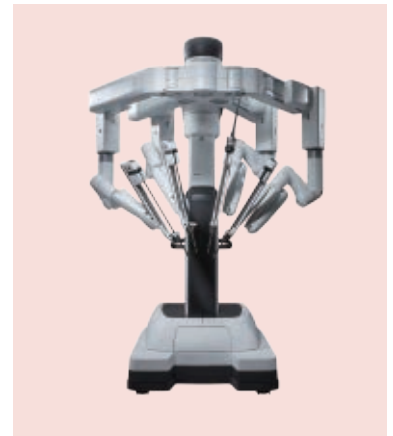
新しく導入されたda Vinci Xi

ヒルロム社の手術台と組み合わせることで、術中にアームをドッキングしたまま患者さんの体位を自由に動かすことができるようになりました。