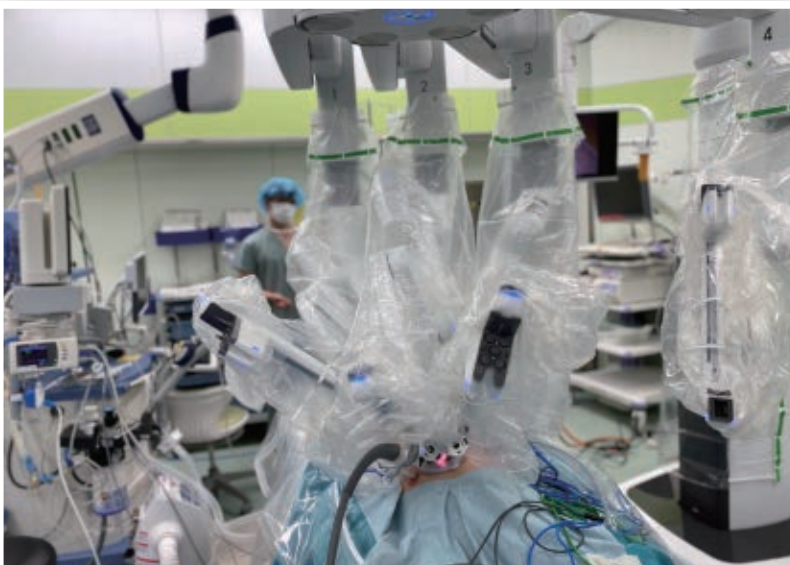
単孔式ロボット支援胃切除術の様子

消化器外科ではこのように新しく導入されたda Vinci Xiを利用することでロボット支援手術の適応を肝切除や結腸切除等に拡大し、患者様により低侵襲な手術を提供できるようにして参ります。